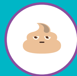
ИЗМЕНЕНИЕ ЦВЕТА КАЛА