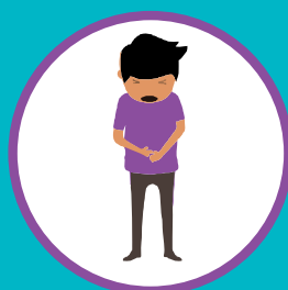
БОЛЬ В ЖИВОТЕ