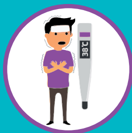
ПОВЫШЕННАЯ ТЕМПЕРАТУРА ТЕЛА