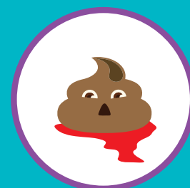
ПРИМЕСИ В КАЛЕ (СЛИЗЬ, КРОВЬ)